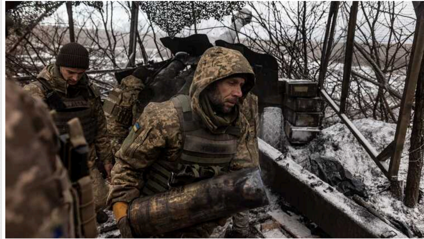
Ситуація на Авдіївському напрямку залишається надскладною, – 3-я окрема штурмова бригада

«Противнику було завдано критичну поразку на рівні полку, але переважаючі кількісно збройні сили РФ не відступають».