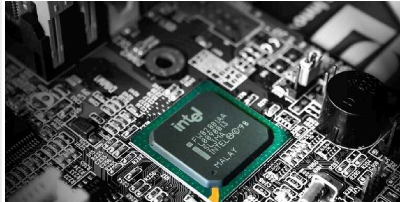
Битва з Китаєм за Тайвань скасовується: США перенесуть виробництво чіпів в інше місце

Американські компанії Micron та Intel вирішили інвестувати в Малайзію.