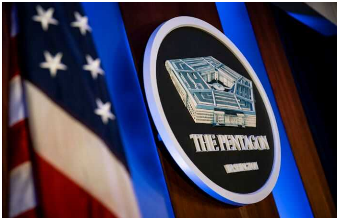
Пентагон оголосив зміст нового пакету військової допомоги Україні на 300 мільйонів доларів

До нового пакету військової допомоги увійдуть: