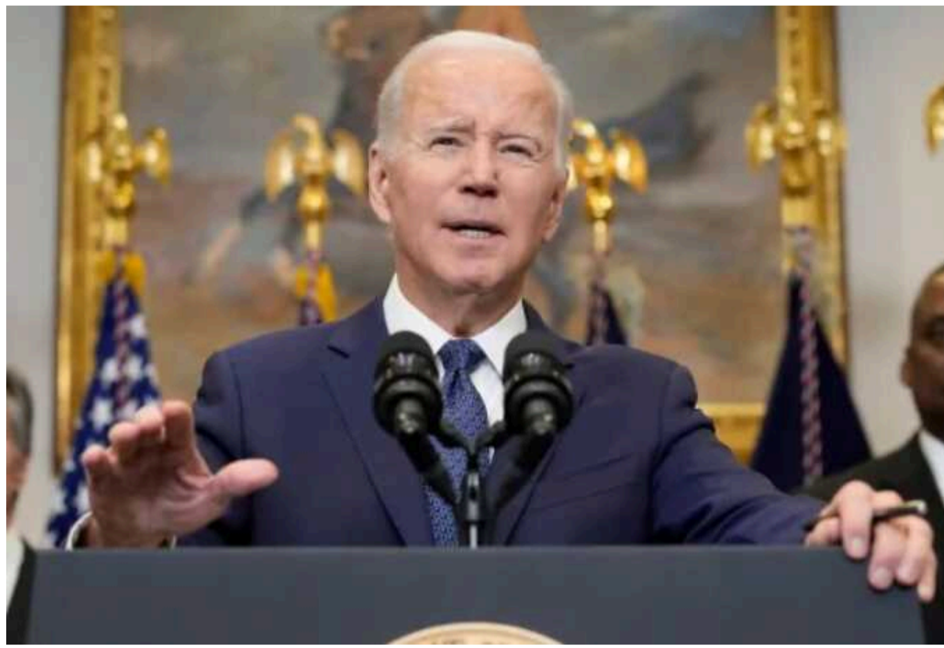
Президент США назвав «недостатньою підтримкою» новий пакет військової допомоги Україні

На думку очільника Білого дому, необхідно діяти негайно, доки президент РФ Путін не став загрозою для всього світу.