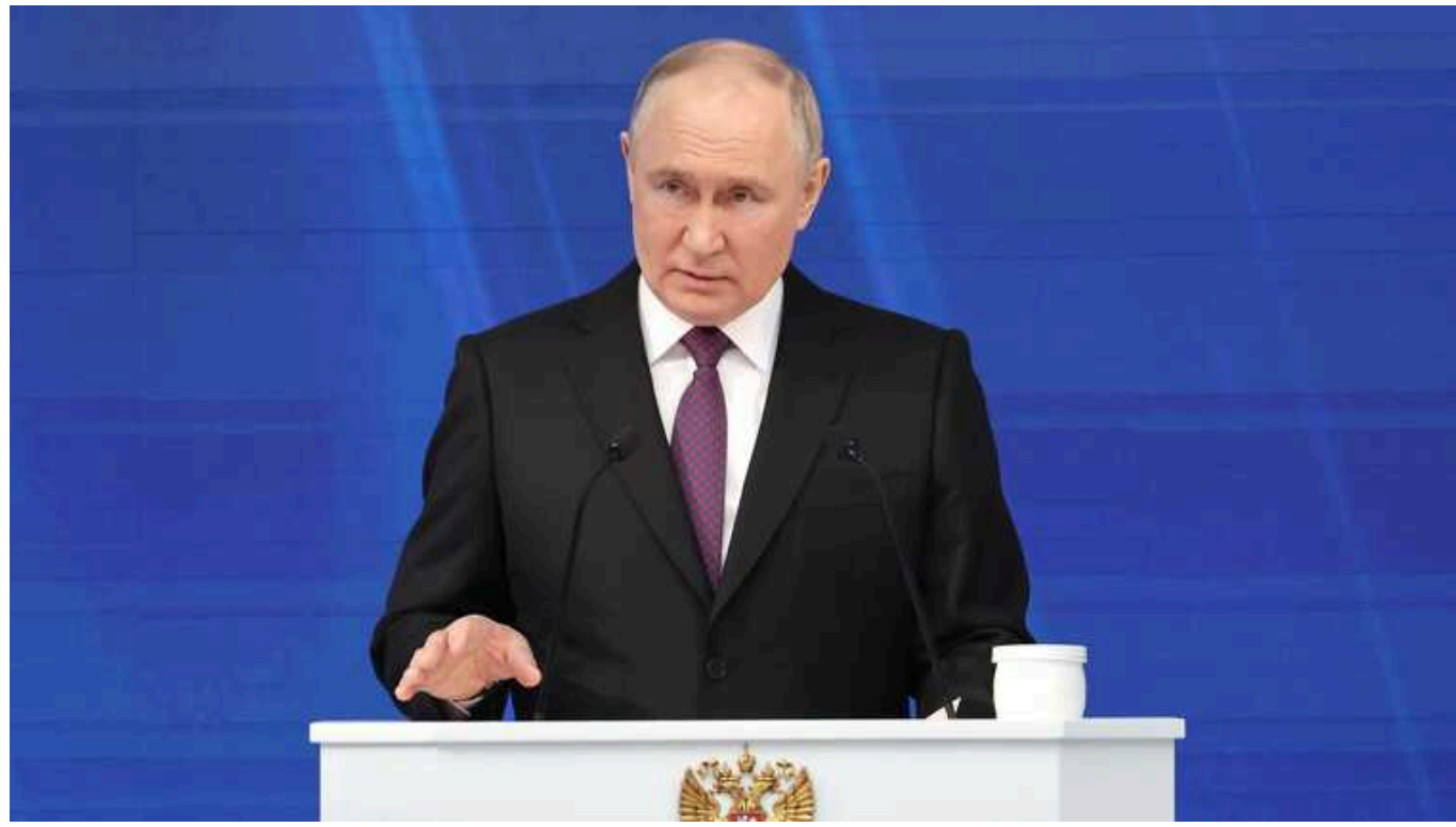
Путін прокоментував масштабний рейд РДК і ЛСР

За словами глави Кремля, такі атаки добровольчих батальйонів відбуваються нібито "на тлі невдач України на лінії зіткнення" і розраховані на "інформаційний ефект".