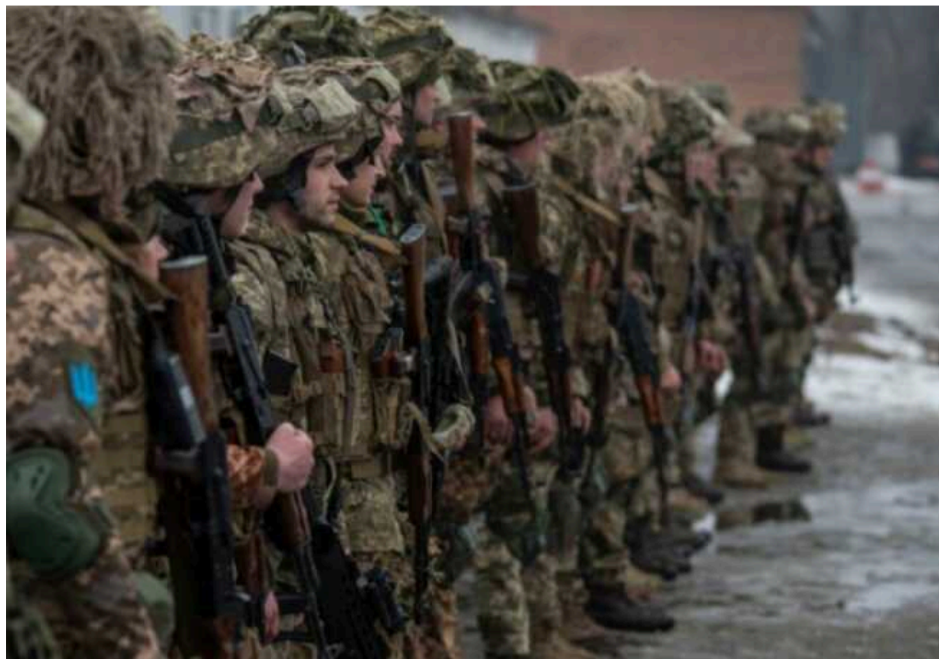
Закон про мобілізацію потрібен для заміни 330 тисяч військових на фронті, – Міноборони

За даними Financial Times, новобранці будуть спрямовані на заміну поранених та задоволення інших потреб на полі бою.