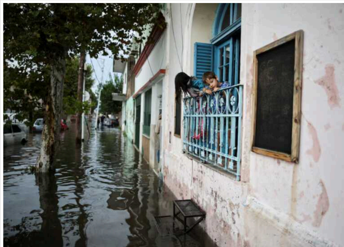
Аргентина через повені йде під воду

Зливи також викликали повені в деяких районах міста Буенос-Айрес. Людям доводиться пробиратися містом, перебуваючи до пояса у воді, а через шторм удари блискавки відбувалися «кожну секунду».