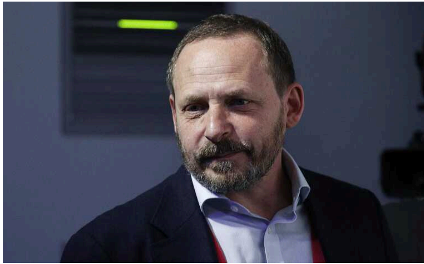
Євросоюз зняв санкції з російського мільярдера Воложа

Аркадій Волож, мільярдер, співзасновник найбільшої російської компанії "Яндекс", був виключений із списку санкцій ЄС. Він не живе в РФ із 2014 року і засудив російську агресію, це й дозволило йому позбутися санкцій.