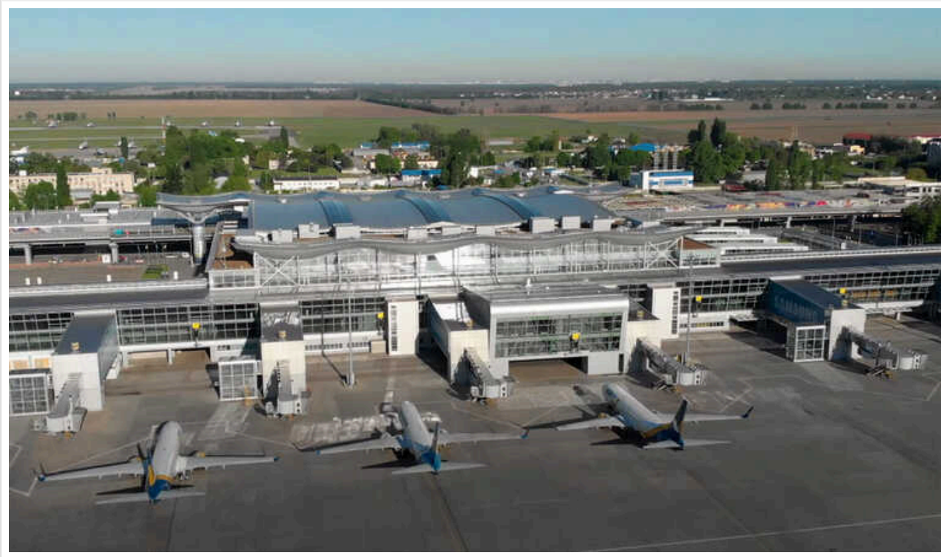
Які аеропорти можуть відкрити в Україні: перевіряли три міста

В Україні делегації перевірили стан аеропортів у Львові, Ужгороді та Києві. При цьому виявилось, що найбільше відповідає стандартам аеропорт столиці. Якщо вдасться забезпечити безпеку, щонайменше один із аеропортів можуть відкрити для польотів.