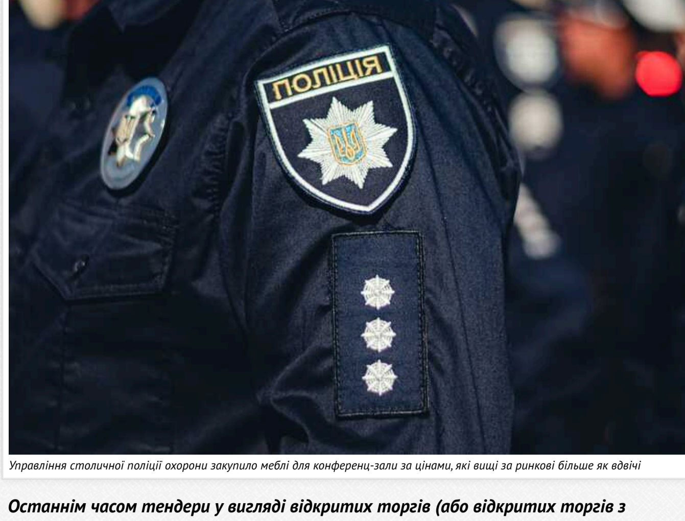
Управління столичної поліції охорони закупило меблі для конференц-зали за цінами, які вищі за ринкові більше як вдвічі

Останнім часом тендери у вигляді відкритих торгів (або відкритих торгів з особливостями) на проведення різного обсягу будівельних робіт, реконструкції та демонтажів все рідше з'являються в електронній системі публічних закупівель Прозако. Можливо, зараз – не сезон, а, можливо, постійна критика з боку громадян нерешті альянсуна, принаймні на публічний прояв, на почасті нецільове використання бюджетних коштів при подібних видах робіт.