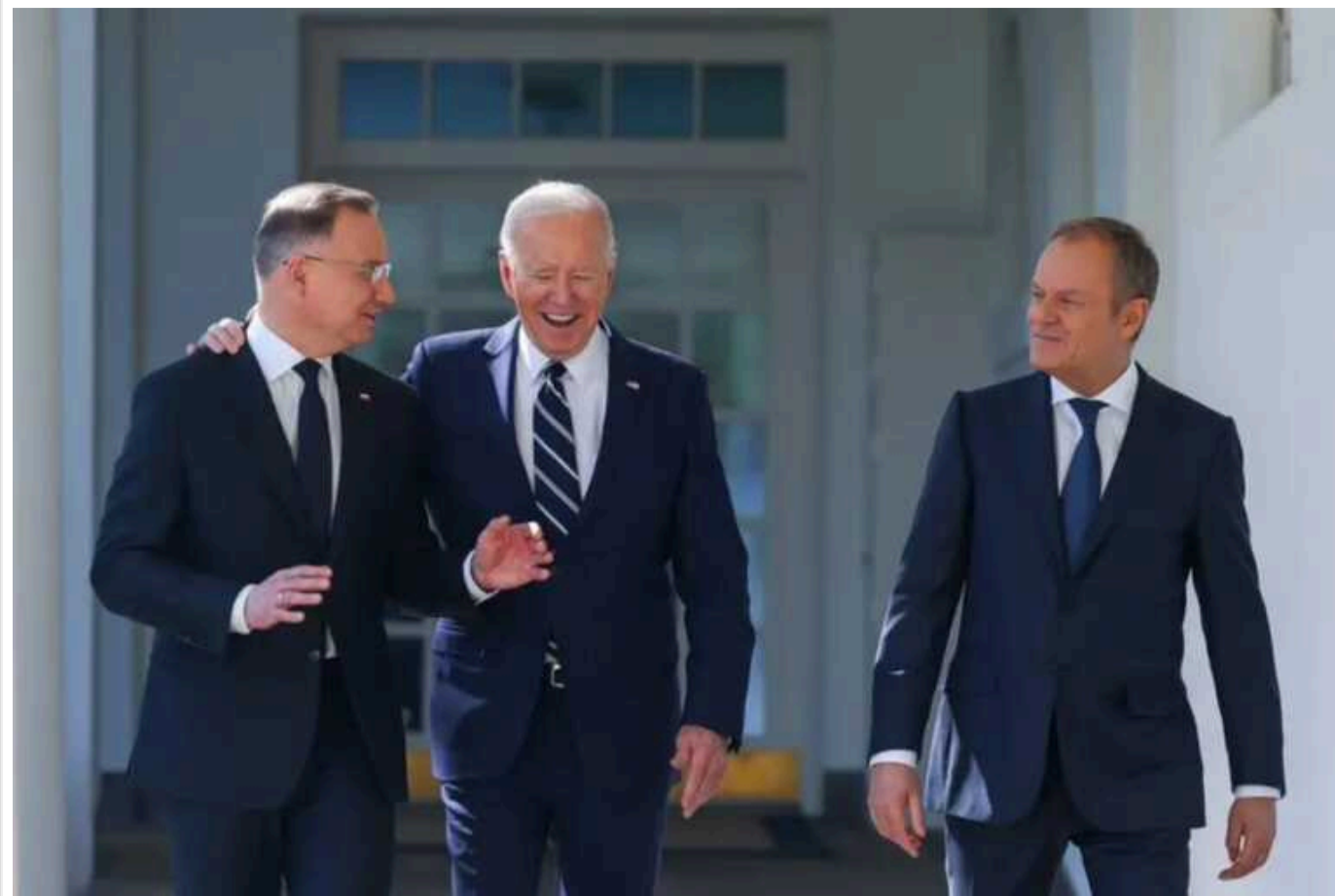
Дуда і Туск зустрілися з президентом США через «передвоєнну ситуацію» у світі

Президент Польщі Анджей Дуда та польський прем'єр-міністр Дональд Туск 12 березня прибули до Білого дому на зустріч із президентом США Джо Байденом.