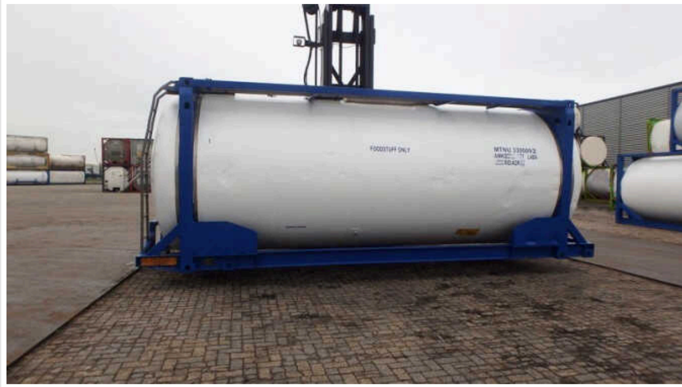
«Державний оператор тилу» замовив спеціальне мастило на 35 мільйонів гривень

На двох тендерах була значна конкуренція з 3-7 фірм. Але по всіх лотах перемогла фірма «Евро ойл продакшн» зі знижкою в середньому 12% від очікуваної вартості торгів.