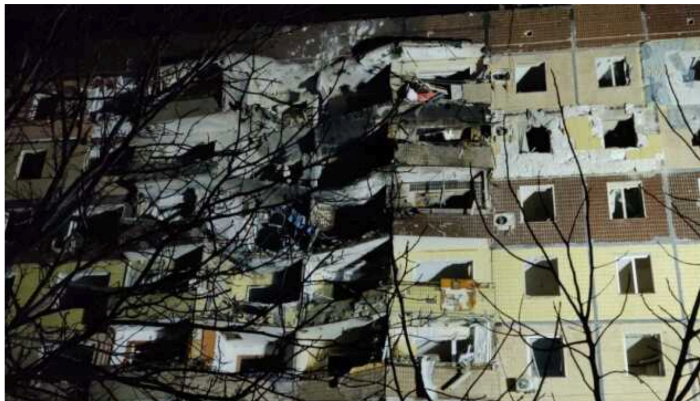
У Кривому Розі кількість жертв від вчорашньої ракетної атаки збільшилась до чотирьох

У лікарні Кривого Рогу померла жінка, постраждала внаслідок вчорашнього ракетного удару.