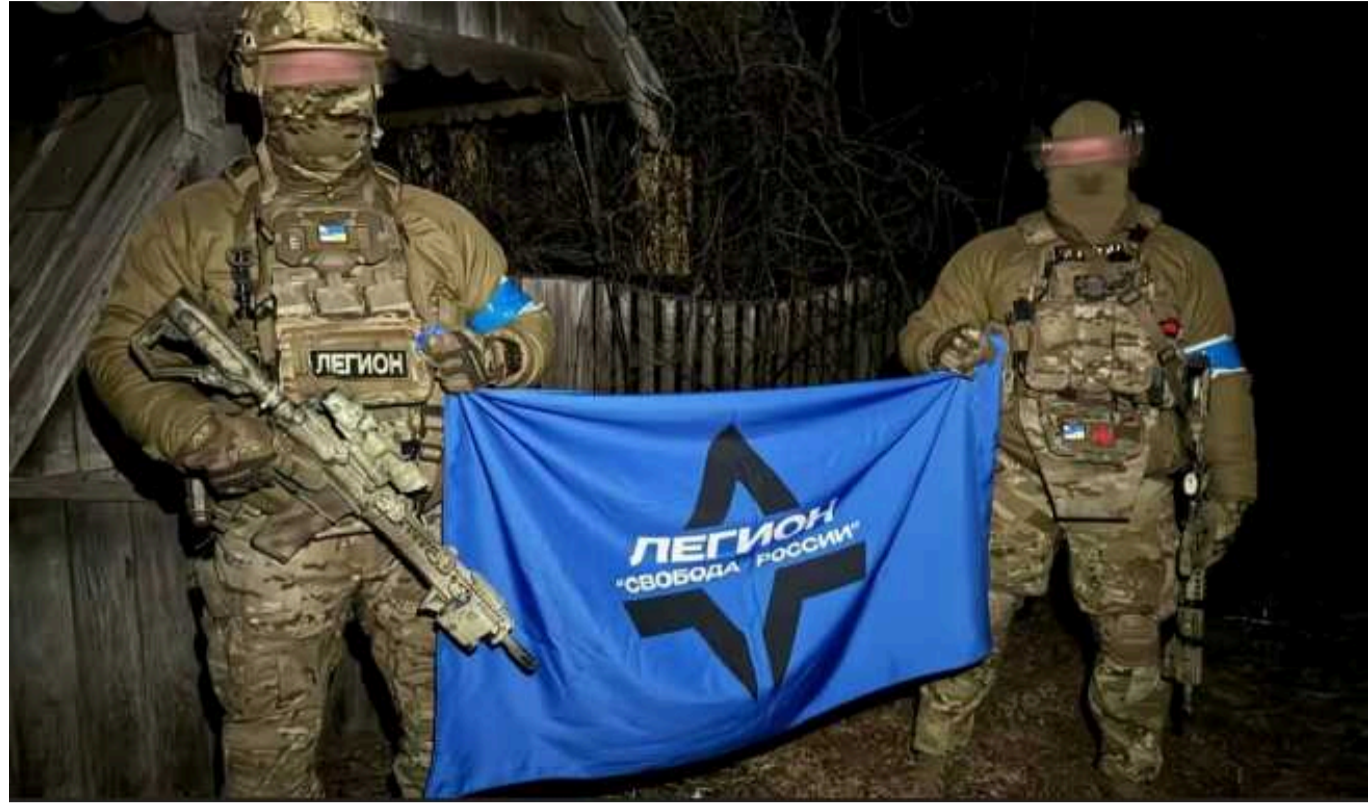
У РФ побоюються нового вторгнення напередодні виборів, – ISW

Росія використовує призовників для захисту свого кордону з Україною та прогнозує нові вторгнення російських добровольчих загонів напередодні виборів.