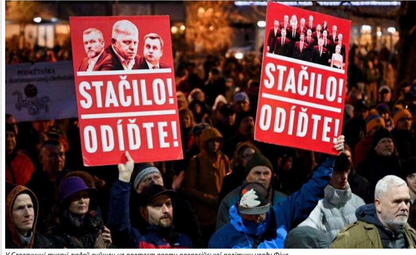
У Словаччині тисячі людей вийшли на протест проти проросійської політики уряду Фіцо

Увечері у вівторок, 12 березня, в столиці Словаччини Братиславі на мітинг вийшли тисячі людей. Вони висловилися проти проросійської політики уряду Роберта Фіцо та на підтримку України.