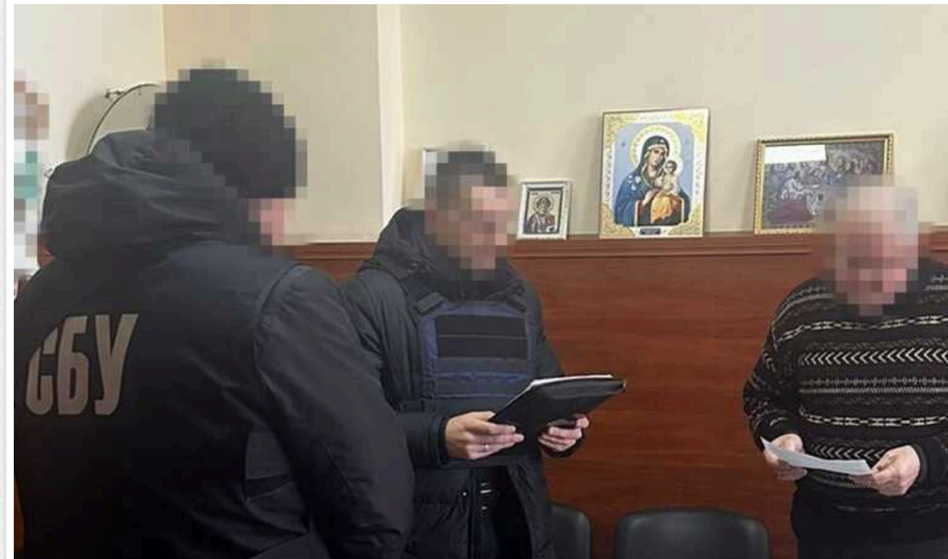
СБУ викрила "схеми для ухиливтів": серед фігурантів - чиновники медустанів та адвокат

В Україні викрили нові "схеми", які допомагають чоловікам призовного віку незаконно виїжджати за кордон.