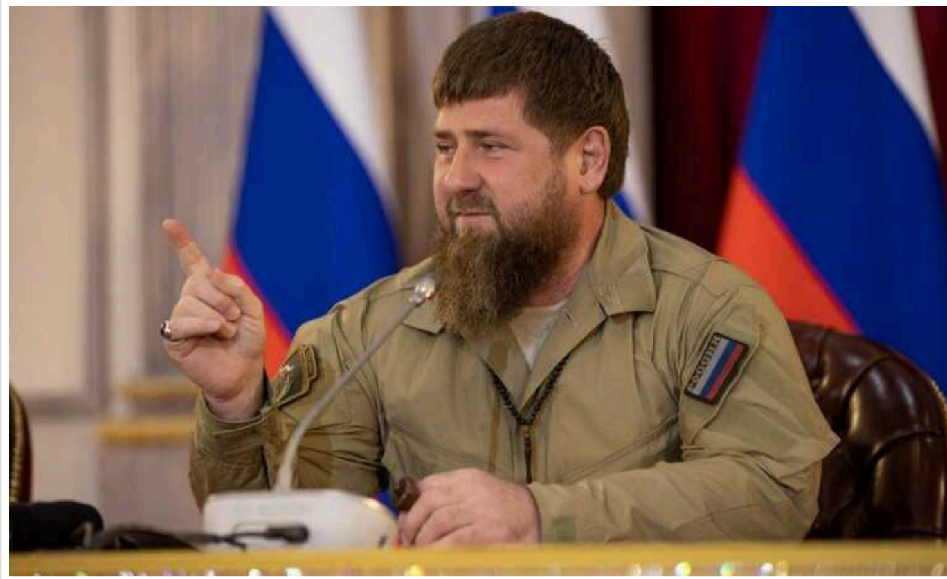
Кадиров міг "купувати" військовополонених ЗСУ для свого обмінного фонду, - ЗМІ