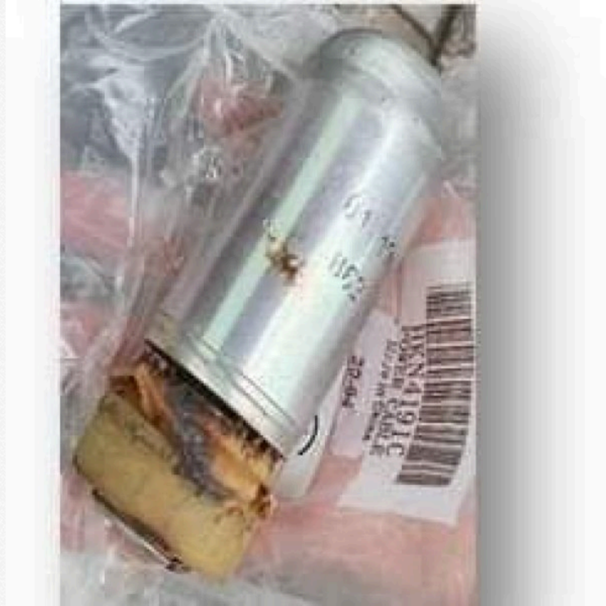
Граната з хімзброєю Fullscreen

Він назвав це свідченням того, що росіяни не можуть виконати свої завдання за допомогою конвенційної зброї: артилерії та дронів – і вдаються до зброї "останньої надії"