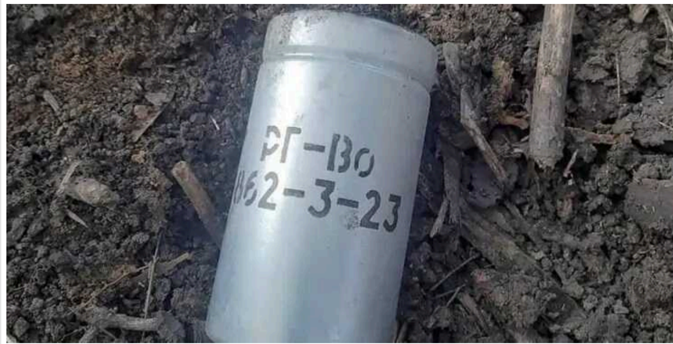
Гранати з хлорпікрином на дронах: ЗС РФ п'ять разів на добу застосовували хімзброю, – ЗСУ

За словами спікера ОСГВ "Таврія", протягом тижня російські війська близько 60 разів застосували цю хімречовину. З початку повномасштабного вторгнення ЗС РФ загалом було 626 хімічних атак.