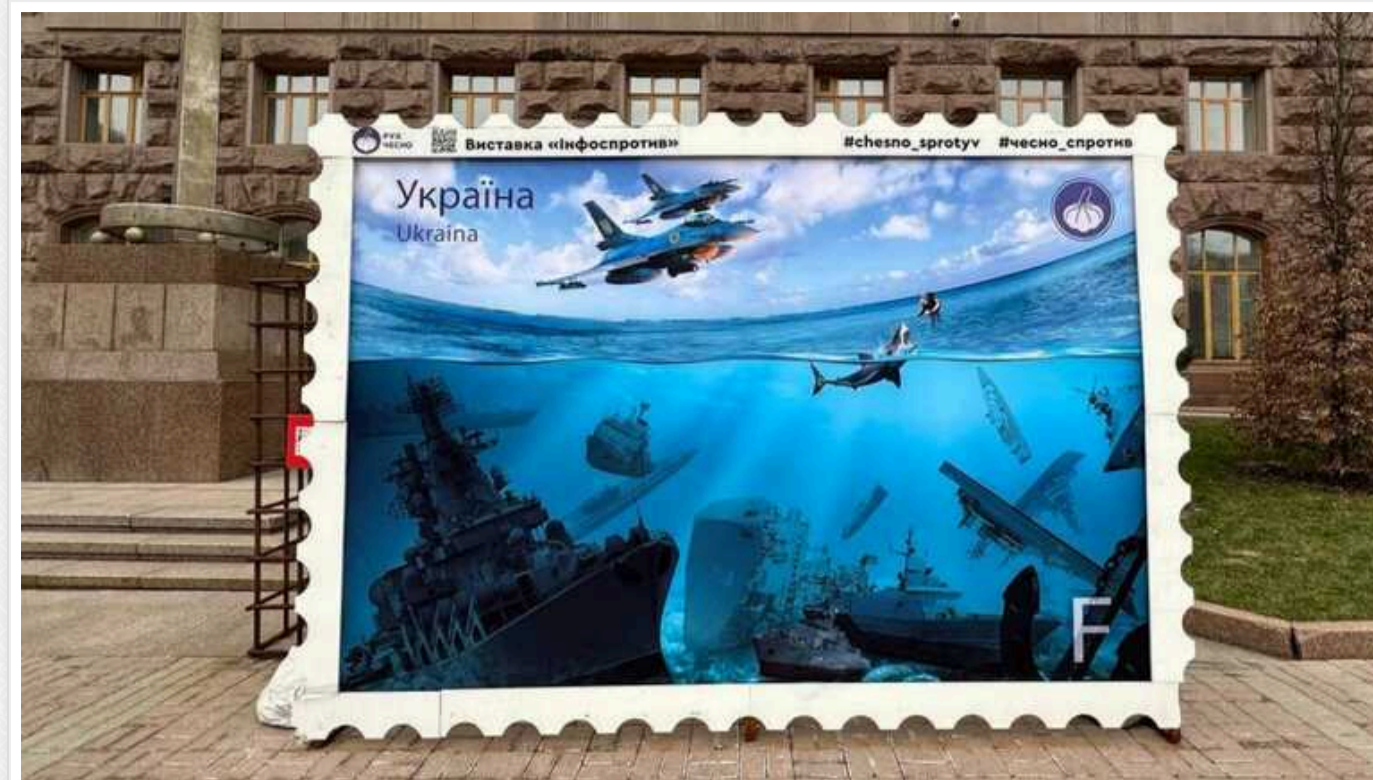
У центрі Києва з'явилася нова фотозона: знищений ворожий флот на дні Чорного моря

У Києві встановлено нову марку-фотозону біля будівлі Київської міської державної адміністрації. На ній зображено затоплений Чорноморський флот Росії.