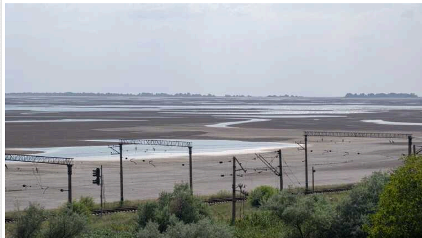
Кабмін заборонив користуватися землями Каховського водосховища

Кабінет міністрів України ухвалив рішення про заборону передачі у власність та використання земель, які займало Каховське водосховище.