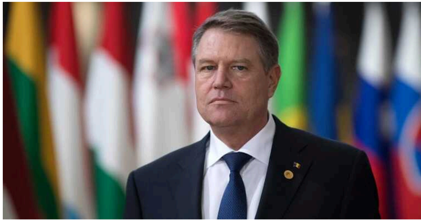
З'явився перший офіційний кандидат на посаду генсека НАТО

Президент Румунії Клаус Йоганніс сьогодні, 12 березня, офіційно оголосив про бажання балотуватися на пост генсека НАТО.