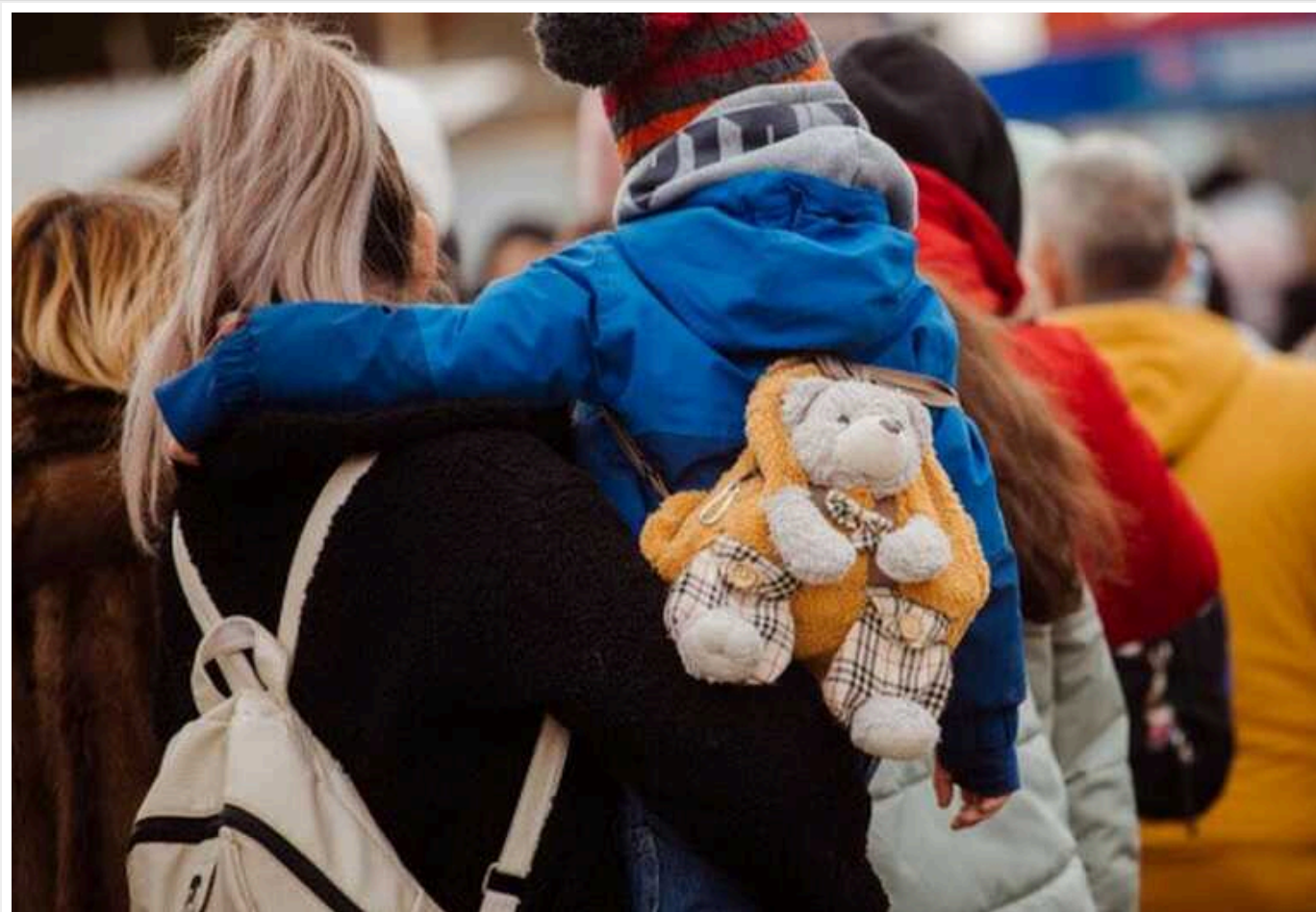
Через війну майже 5 мільйонів українців за кордоном: значна частина може не повернутися

На кінець січня 2024 року за кордоном через війну перебуває 4,9 млн українців. Від 1,4 до 2,3 млн осіб можуть залишитись за межами України.