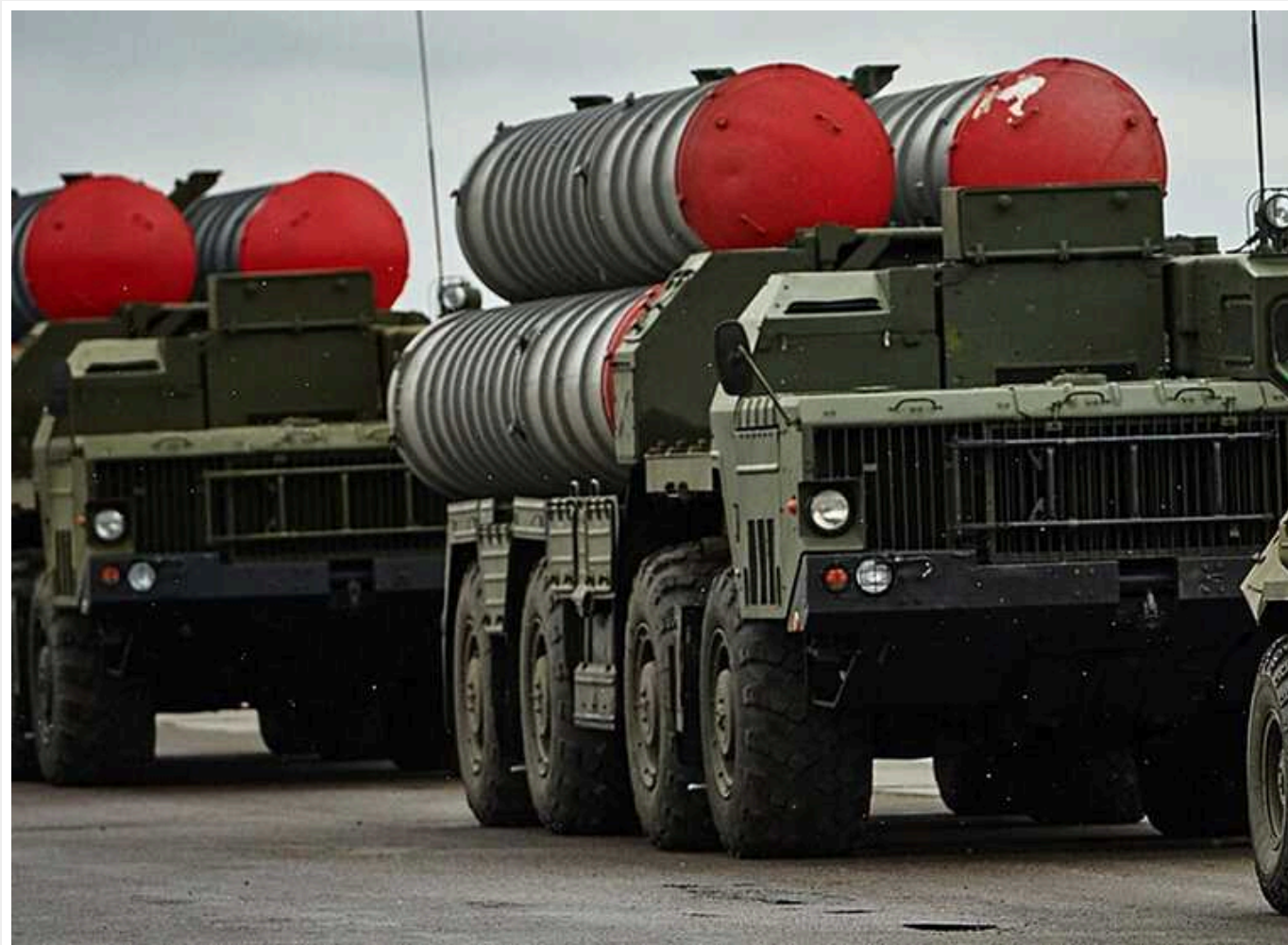
Три "прильоти" по Харківській області: окупанти завдали ударів ракетами С-300