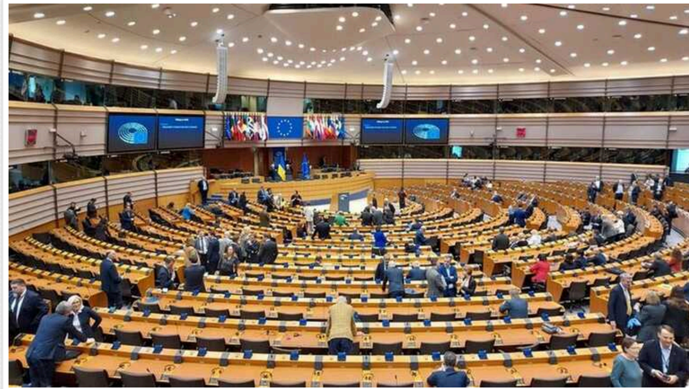
Європарламент підтримав криміналізацію обходу санкцій: це дасть змогу конфіскувати активи РФ

В ЄС під час голосування підтримали криміналізацію обходу санкцій. Порушників можуть очікувати штрафи або конфіскація активів.