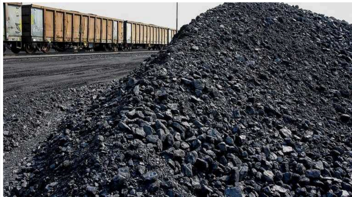
СБУ закрила справу щодо закупівлі фірмами екснардепа вугілля з «ЛНР»

Після недовгих обшуків та арештів майна СБУ та прокуратура закрила справу щодо закупівлі вугілля з «ЛНР» для українських ТЕЦ через нібито відсутність в діянні складу кримінального правопорушення.