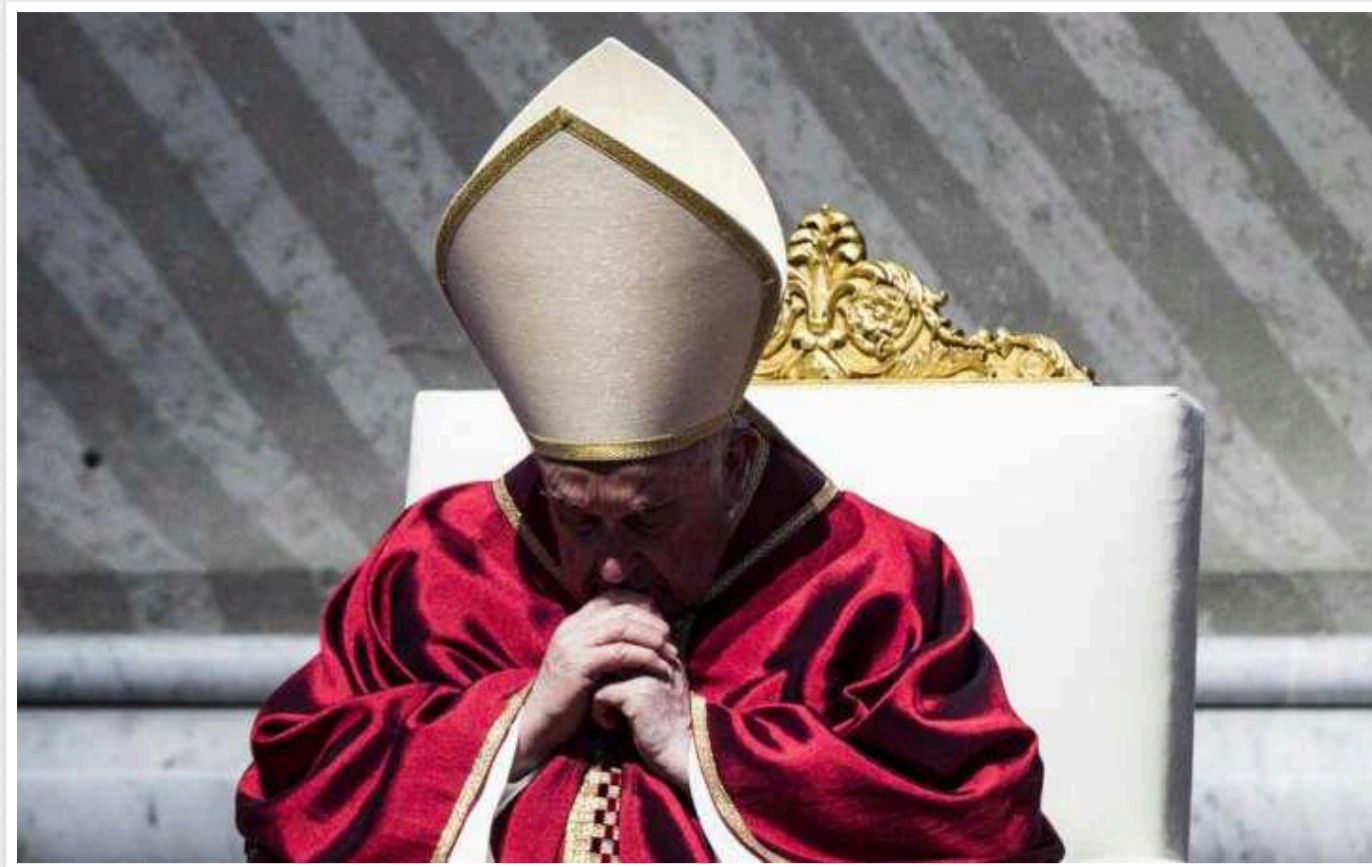
Три питання до Папи Франциска і держави Ватикан та заява постійного Синоду УГКЦ з приводу угоди з дияволом

Пропозиція Папи Римського Франциска Україні піти з білим прапором до диявола просити переговорів, викликає бурю обурення не лише серед звичайних громадян в самій Україні, а й серед священнослужителів та теологів.