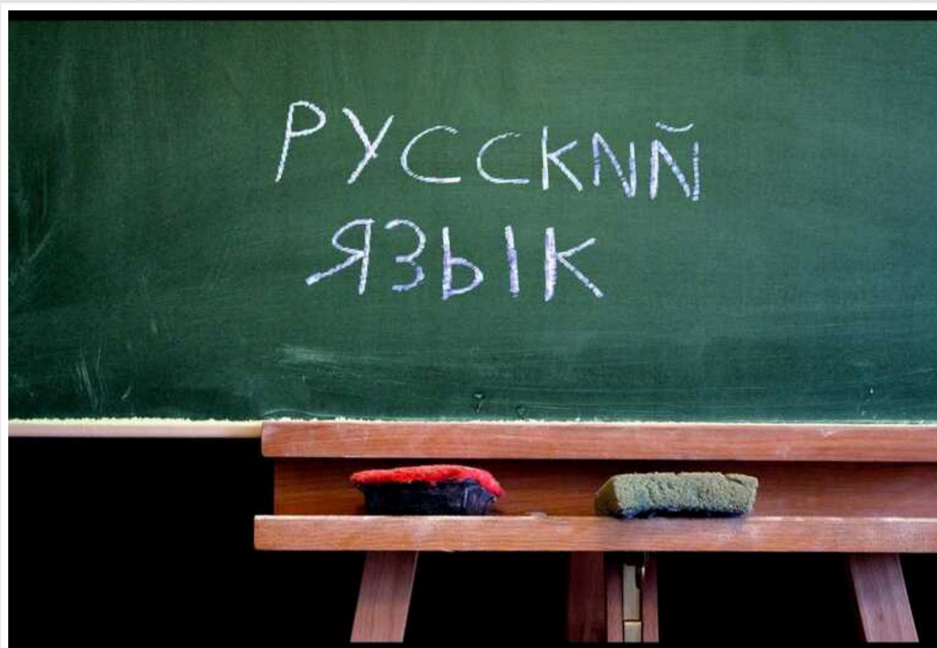
Скільки українців вважають, що російську мову треба усунути з офіційного спілкування, - опитування

Більшість громадян України бажають усунення російської мови з офіційного спілкування на всій території країни, або проти її використання у своєму регіоні. Водночас є відсоток тих хто воліє бачити мову агресора офіційною там, де живе, або навіть другою державною.