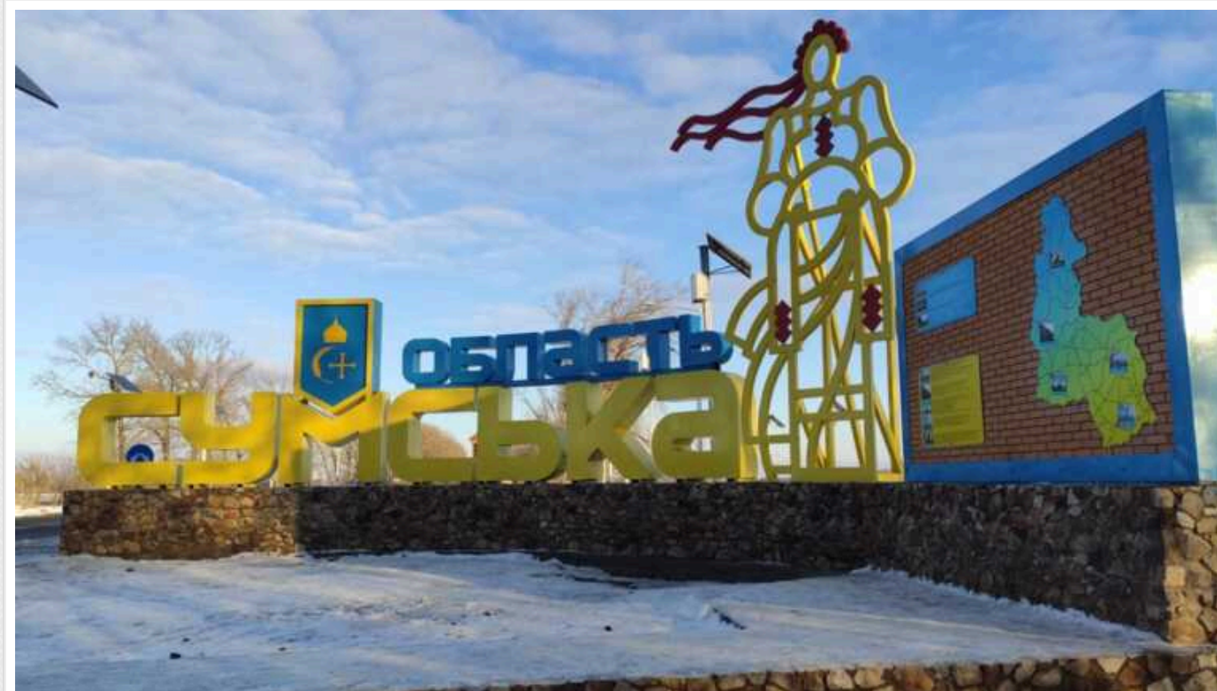
На Сумщині попереджають про чергову хвилю російських фейків щодо "наступу"

Росія розповсюджує чергову хвилю фейків про "наступ" на територію Сумської області. Дані дії зумовлені бажанням ворога дестабілізувати ситуацію в регіоні та підвищити панічні настрої серед його населення.