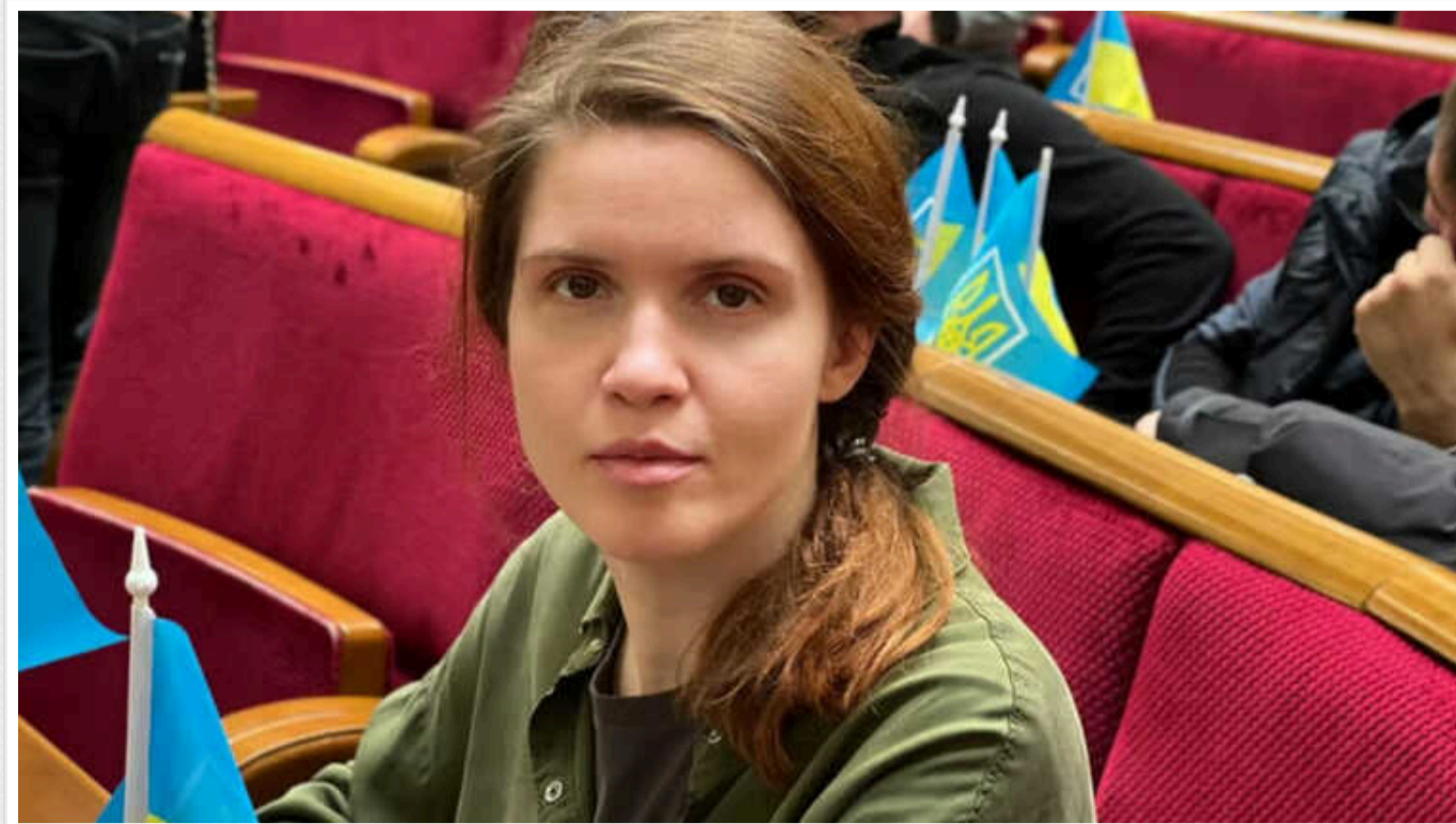
Нардеп Безугла пише про «паніку» Завітневича після правок у законопроекті щодо мобілізації про відповідальність для ухиялнтів