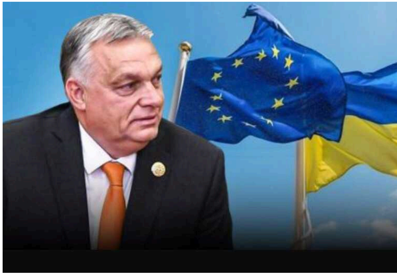
Угорщина намагається заблокувати вступ України до ЄС, – ЗМІ

Європейська комісія (ЕК) готується вже 13 березня надати послам ЄС мандат на переговори щодо членства з Україною. Однак, процес старту цих переговорів знову намагається заблокувати Угорщина, яка має намір виставити Україні додаткові умови. Ці умови традиційно можуть зачепити питання угорської мови в Україні.