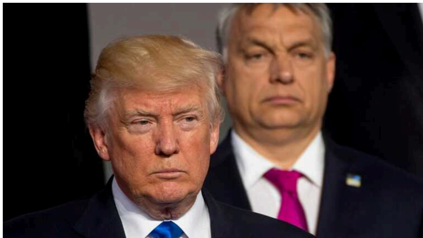
Трамп через Орбана озвучив «мирний план» по Україні. Чому це ще не зрада

До початку зустрічі Трамп та Орбан заявляли, що головними темами будуть "широкий спектр питань, що стосуються Угорщини та США, а також як покласти край війні Росії з Україною". Здається, цей "край" обидва одіозні політики бачать лише в капітуляції України.