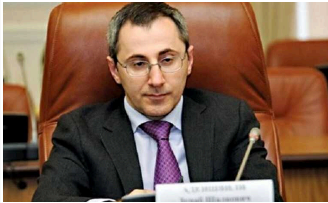
Навіщо Грузія зробила запит на екстрадицію з України співробітника Офісу Генпрокурора Зураба Адеїшвілі

Наразі Адеїшвілі обіймає посаду голови Департаменту міжнародно-правового співробітництва Офісу Генпрокуратура. Серед його функцій – питання екстрадиції.