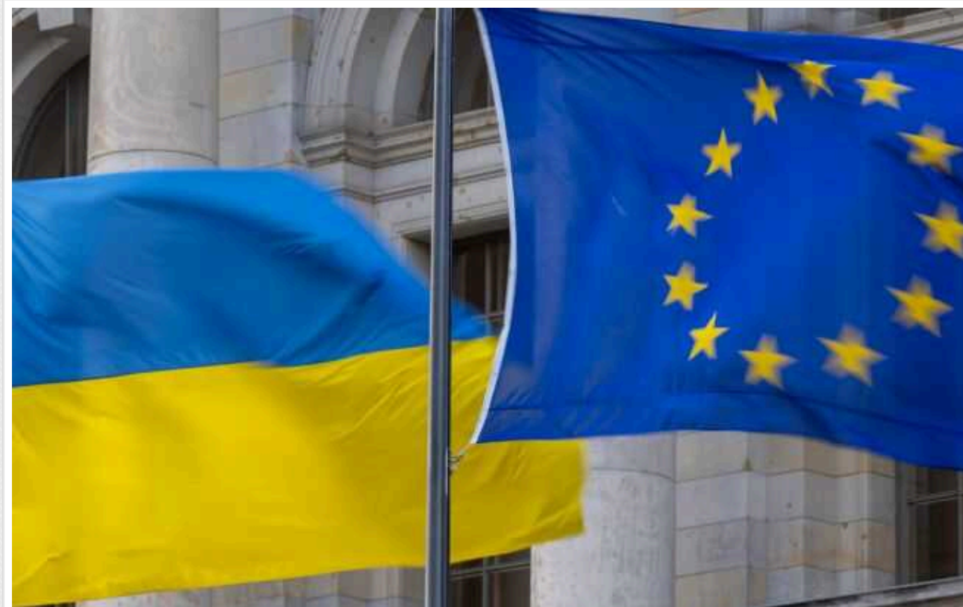
Financial Times: ЄС планує виділити Україні 3 млрд євро із заморожених активів РФ не пізніше літа

У Європейському Союзі хочуть передати Україні близько 3 млрд євро за рахунок прибутку, отриманого від заморожених активів країни-агресора Росії. У планах ЄС передати Києву ці кошти не пізніше літа 2024 року.