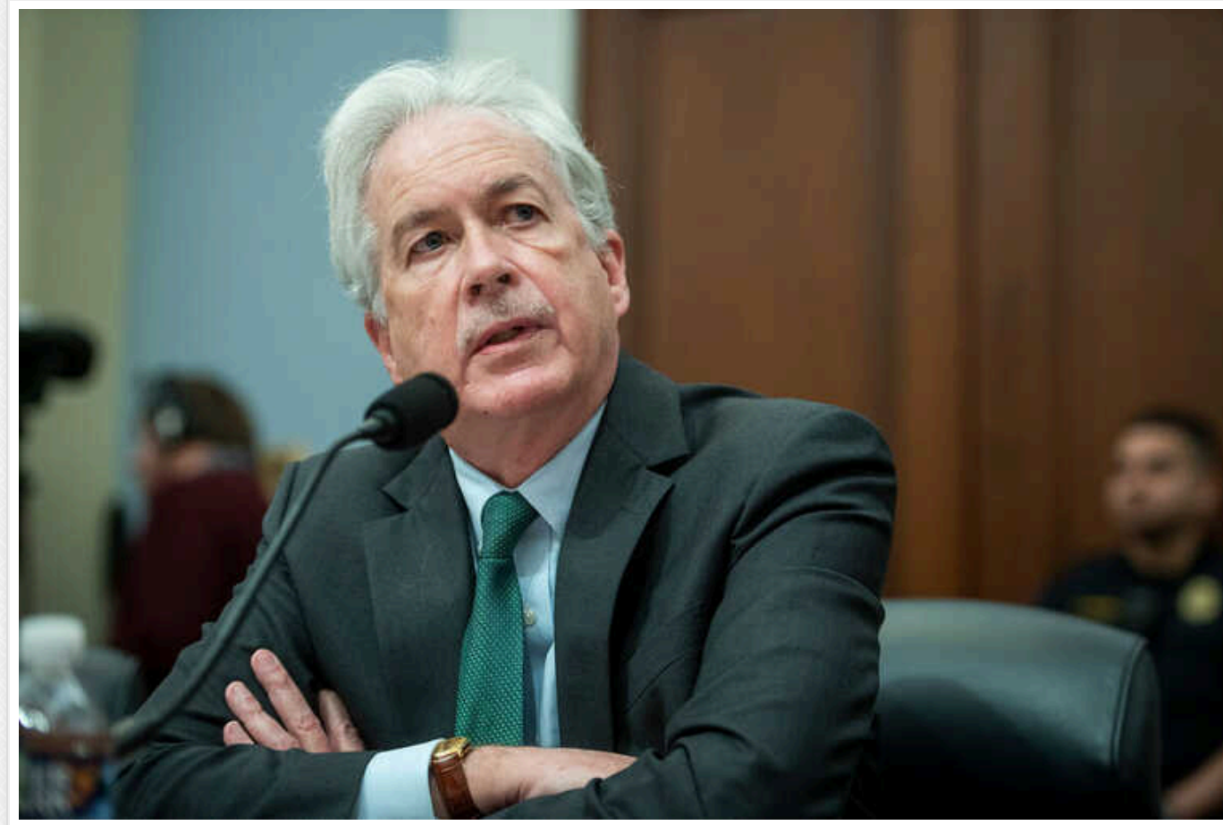
«Можемо побачити більше Авдіївок»: директор ЦРУ закликав дати ЗСУ зброю і застеріг США від «великої помилки»

Директор Центрального розвідувального управління США Вільям Бернс заявив, що Україна може втратити більше територій, якщо не отримає достатньо військової допомоги від партнерів. За його словами, для Штатів це буде "великою помилкою".