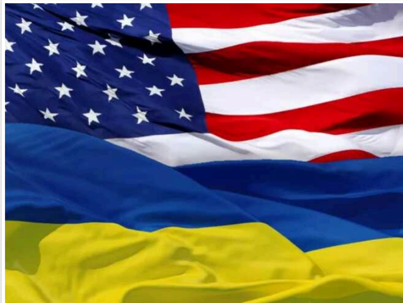
У проєкті бюджету США на 2025 рік для України закладено 482 млн доларів, – Держдеп

Сполучені Штати Америки мають намір й надалі підтримувати Україну грошима. У бюджетному запиті президента на 2025-й фінансовий рік передбачено 1,5 мільярда доларів на протидію агресії Кремля, з них 482 мільйони доларів – для нашої держави.