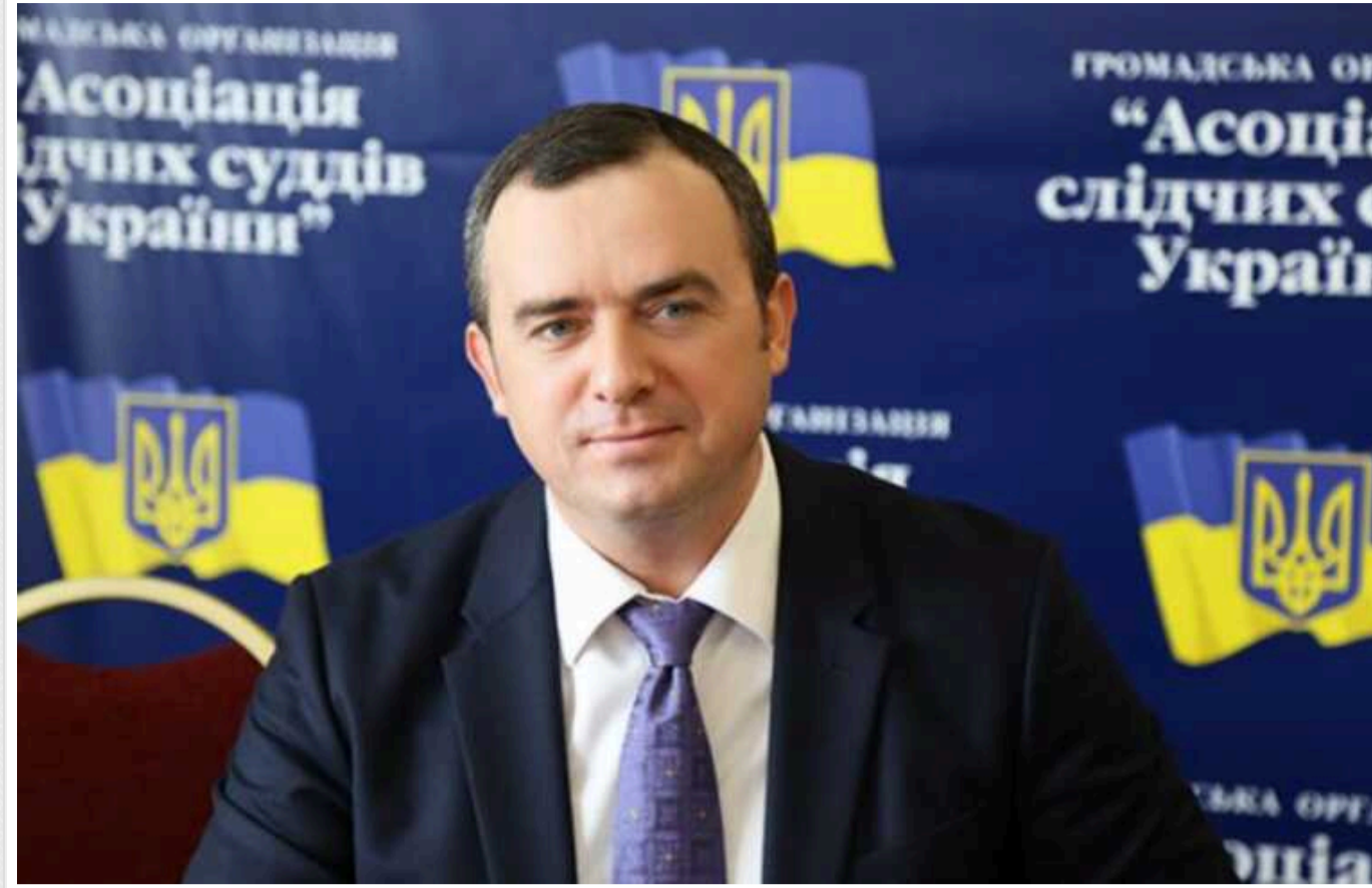
В Одесі голова райсуду майже не виконує обов'язки слідчого судді

Голова Київського райсуду Одеси Сергій Чванкін, який обіймає посаду понад 13 років, фактично самоусунувся від виконання обов'язків слідчого судді та не виносить вироків.