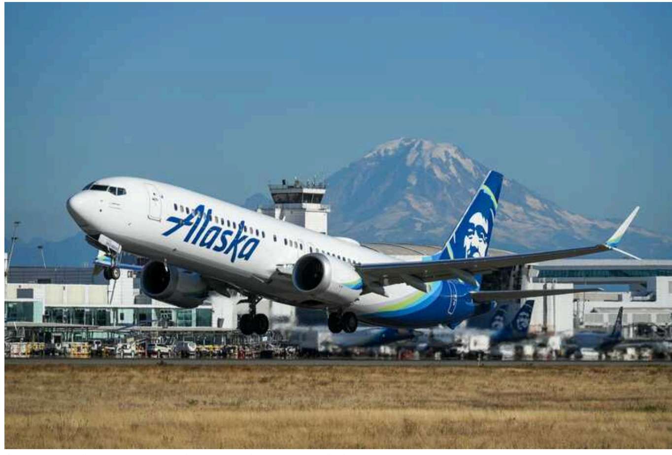
Акції Boeing падають на тлі розслідування інциденту із 737 MAX 9

Падіння акцій американського авіаконцерну Boeing перевищило 25% після того, як Міністерство юстиції порушило кримінальне провадження щодо нещасного випадку з літаком 737 MAX 9 компанії Alaska Airlines.