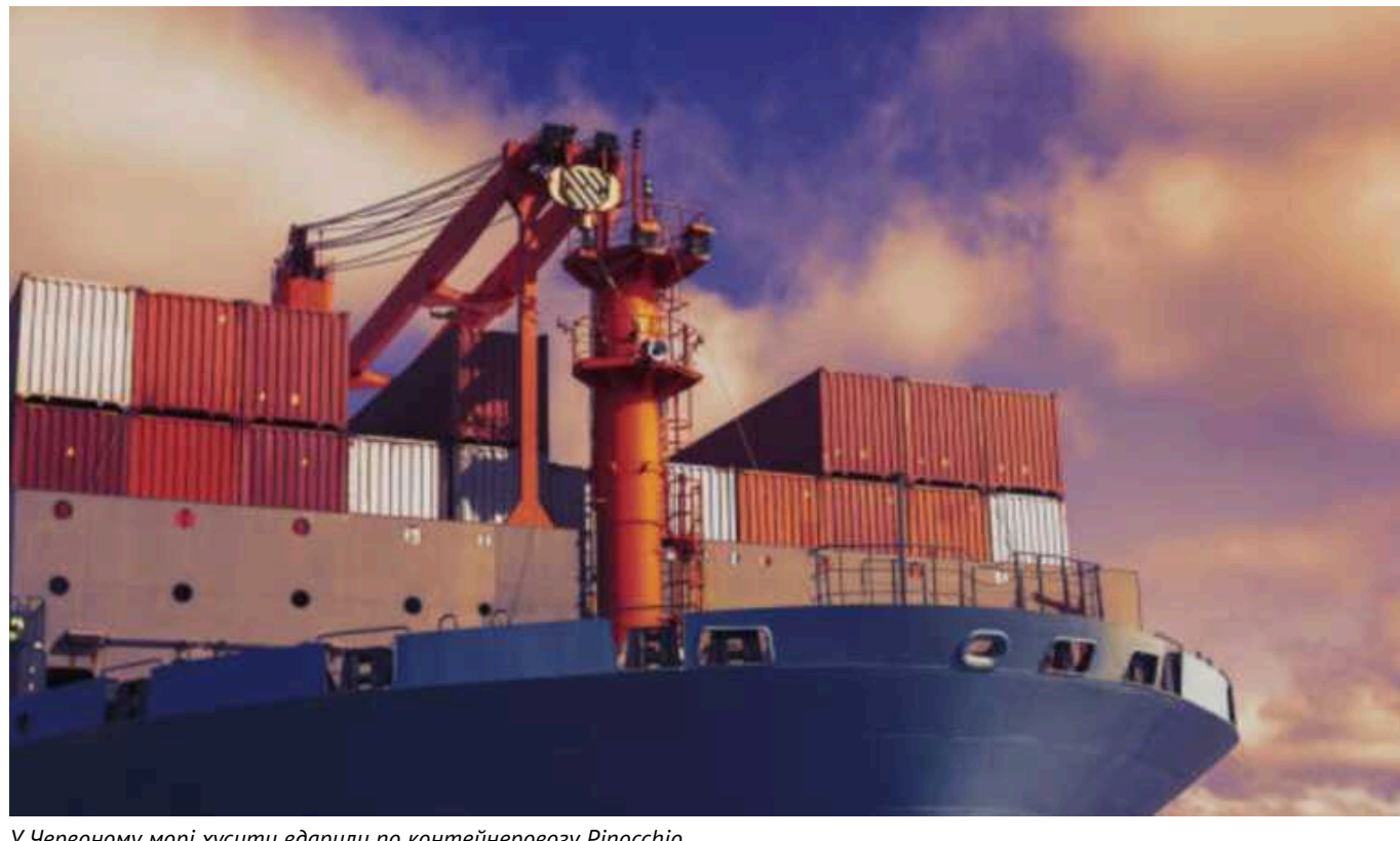
У Червоному морі хусити вдарили по контейнеровозу Pinocchio

Контейнеровоз Pinocchio потрапив під обстріл хуситів у Червоному морі.