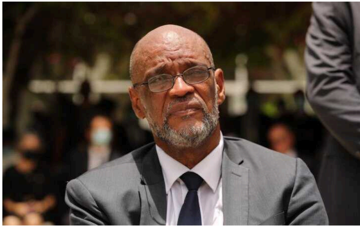
Прем'єр Гаїті на тлі повстання банд подав у відставку

Виконувач обов'язків прем'єр-міністра Гаїті Аріель Анрі, який очолив країну після вбивства в 2021 році її останнього президента, піде у відставку, як тільки призначать перехідну раду та тимчасову заміну.