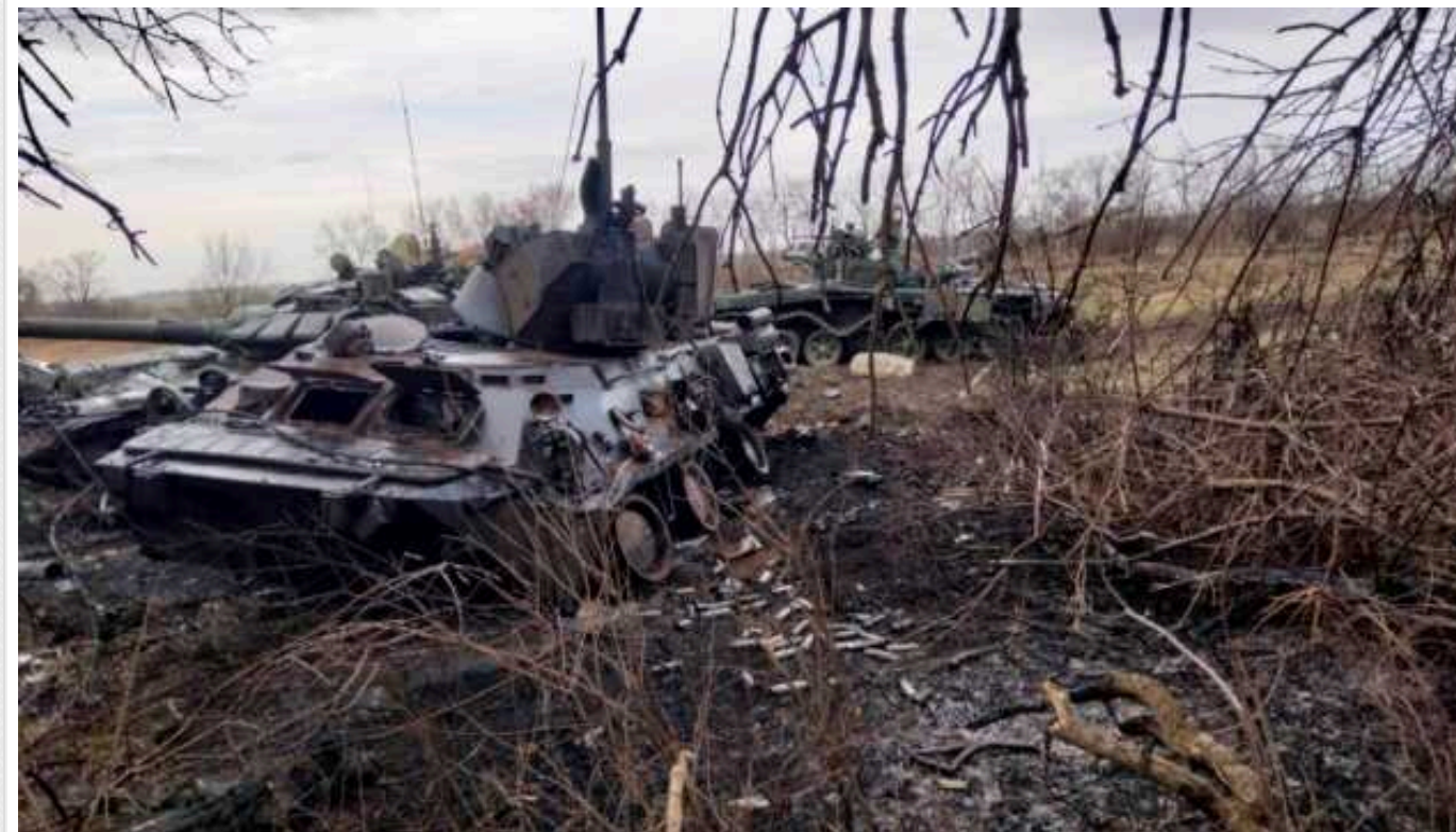
Втрати ворога: окупанти за добу втратили в Україні ще 910 військових

Загальні бойові втрати армії Російської Федерації в Україні з 24 лютого 2022 року по 12 березня 2024 року становлять близько 425 тисяч 890 осіб, з них 910 загарбників – за попередню добу.