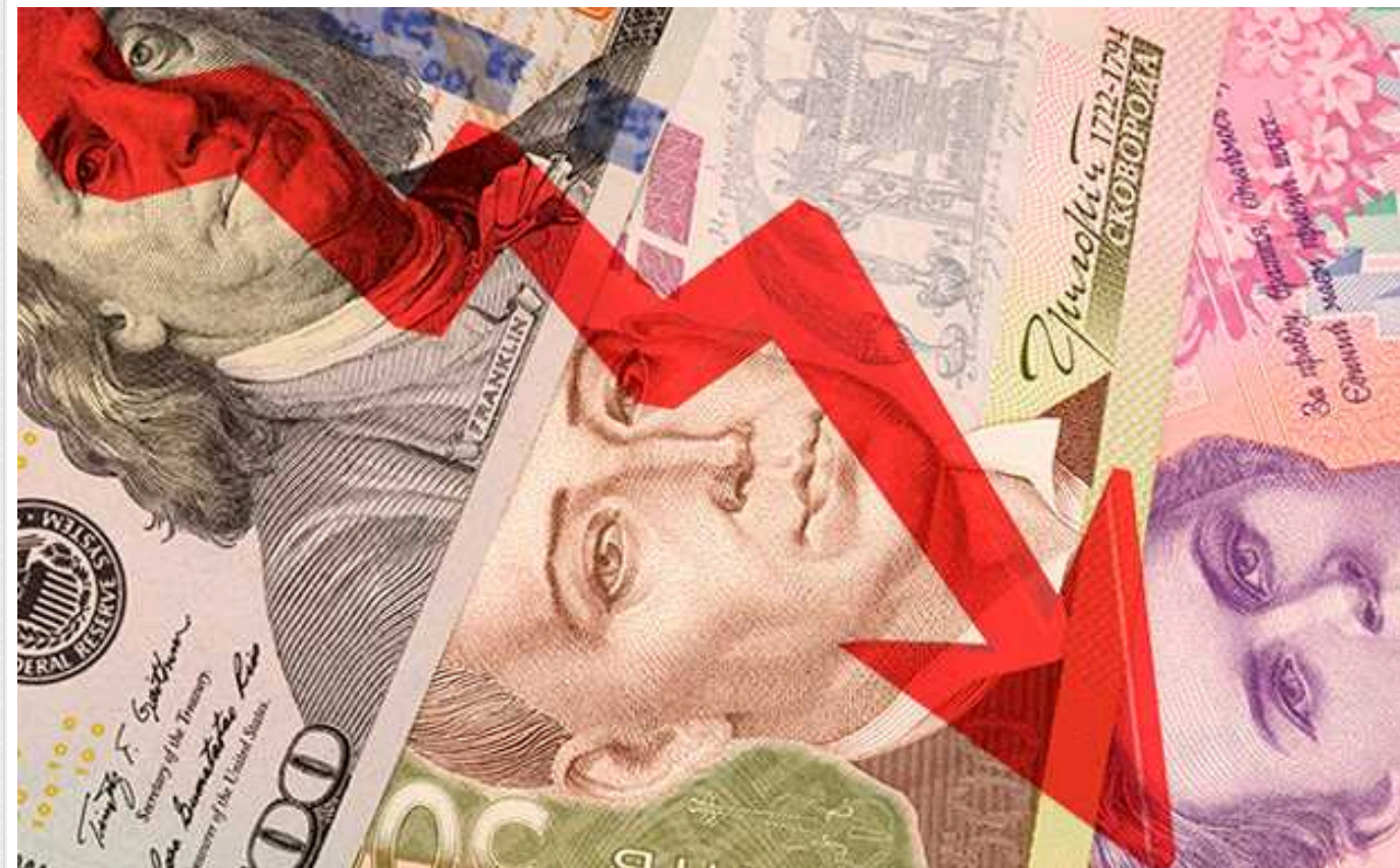
На Україну чекає девальвація гривні аж до 49,32 гривень за долар, не дивлячись на отримання зовнішньої допомоги, – S&P

Міжнародне рейтингове агентство S&P Global Ratings прогнозує гривні за підсумками 2024 року девальвацію курсу до долара на 8% – до 41,02 грн/$. Він вказаний як прогнозований в останньому звіті агентства по Україні.