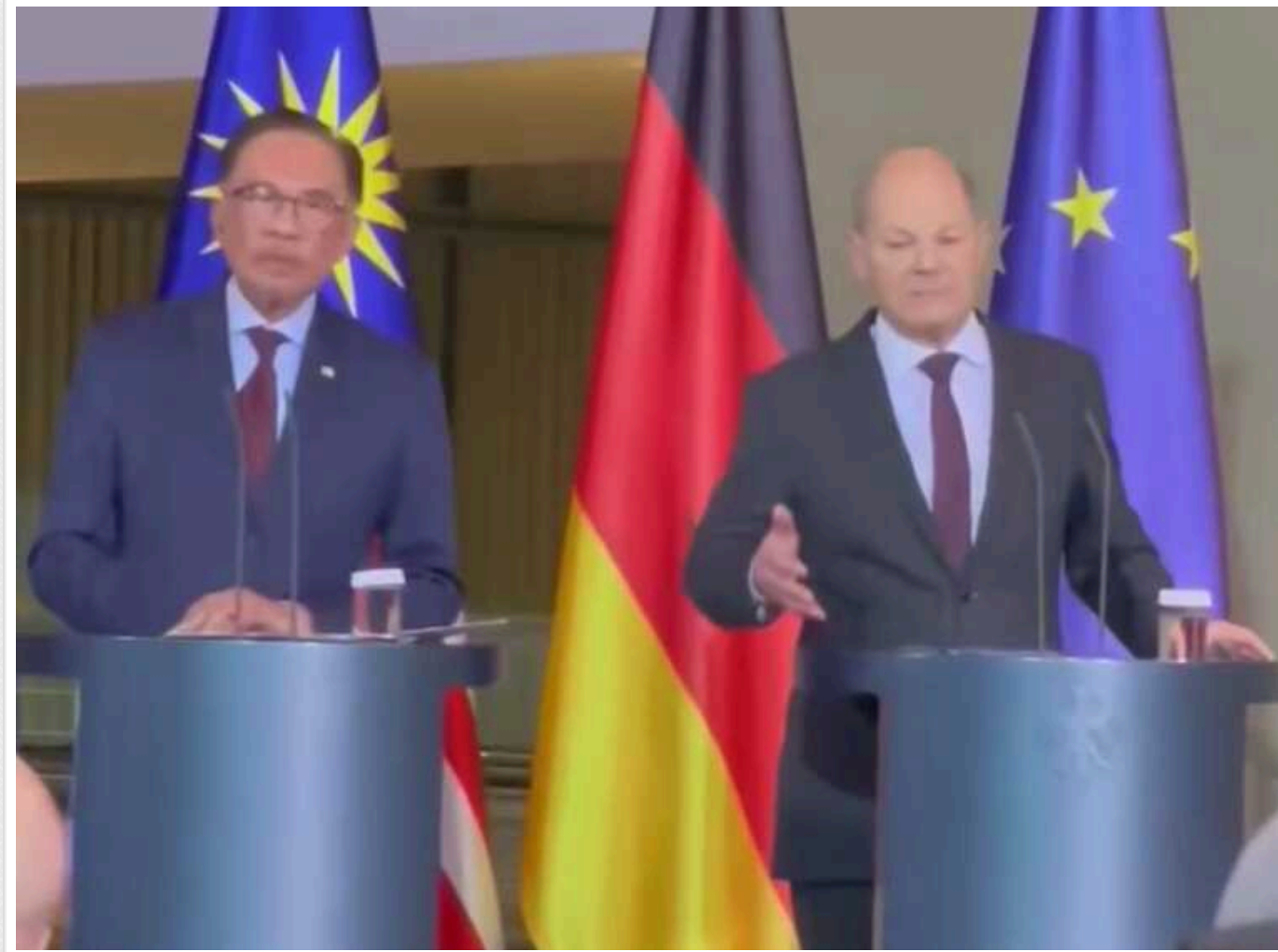
Шольц відкинув можливість обміну далекобійними ракетами з Британією

Про це він заявив на спільному брифінгу із прем'єр-міністром Малайзії Анваром Ібрагімом, повідомляє Bloomberg.