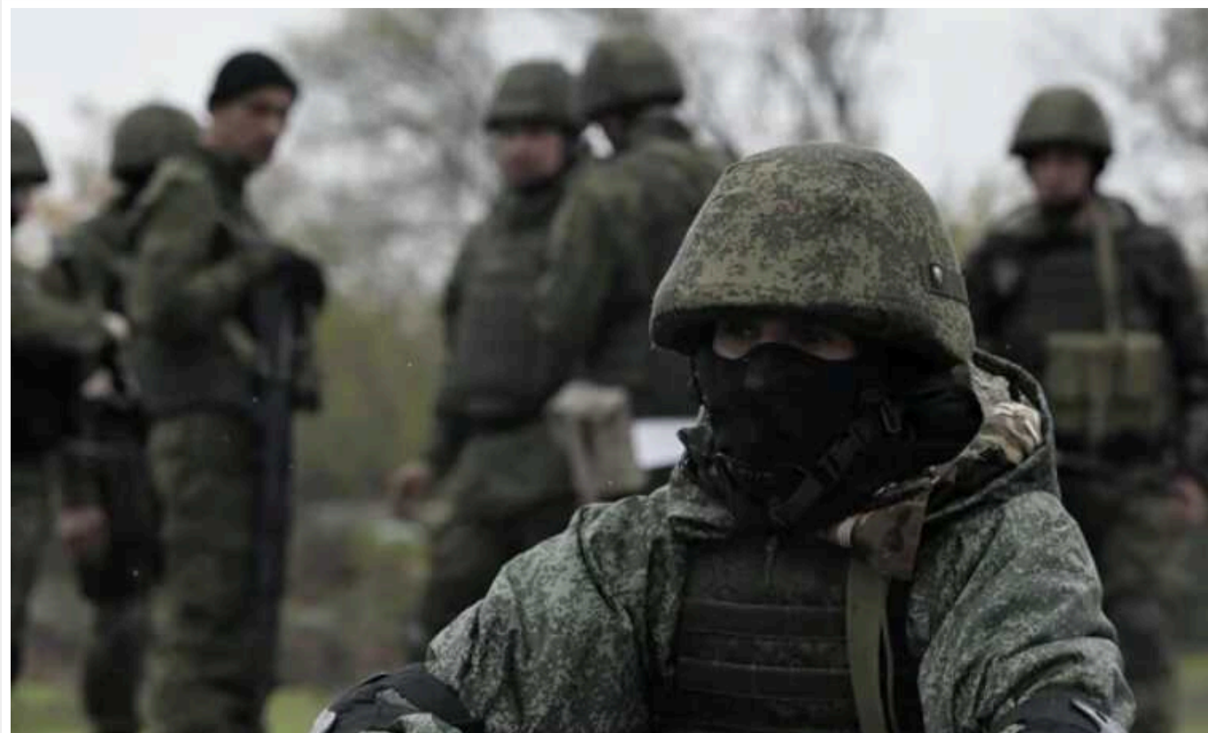
Під Новомихайлівкою поблизу Мар'їнки наступ посилюється, – ЗСУ

За словами спікера ОСУВ "Таврія", зіткнень з російськими військами також побільшало біля населених пунктів Старомайорське та Урожайне Времівського виступу.