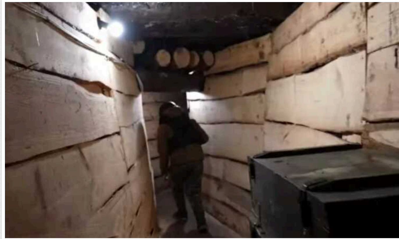
В Мережі показали як виглядають українські фортифікації на Харківщині

Один з бійців бригади "Сталевий кордон", яка знаходиться у Харківській області уже 7 місяців, наголошує, що основним в укріпленнях є саме безпека, адже три накати колод, які зверху засипані землею, дають змогу витримати пряме влучання 152-мм снаряду.