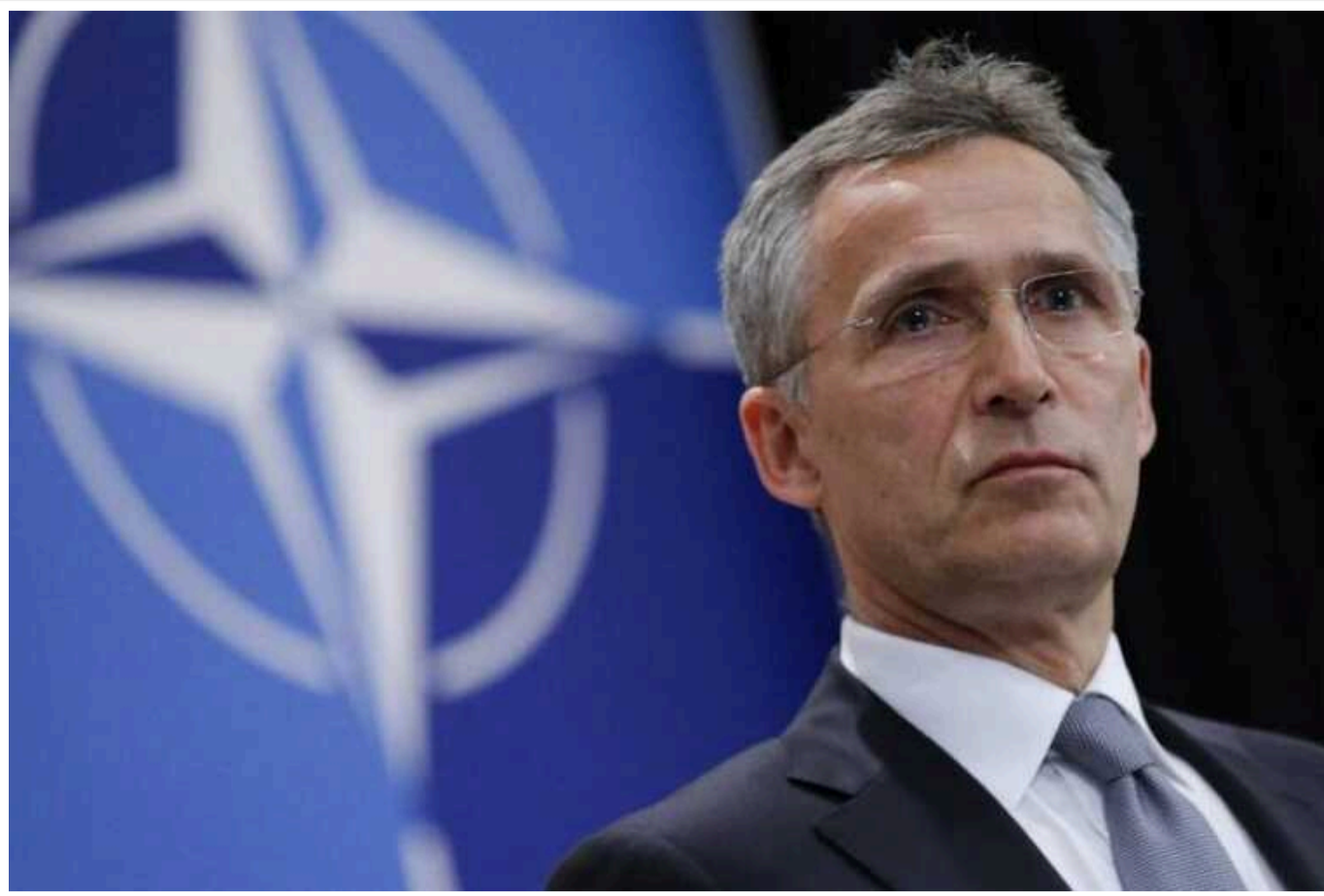
Столтенберг оцінив рівень загрози атак РФ на Швецію

Генсек НАТО поки не бачить жодної безпосередньої військової загрози проти будь-якого члена НАТО, але закликає не втрачати пильності.