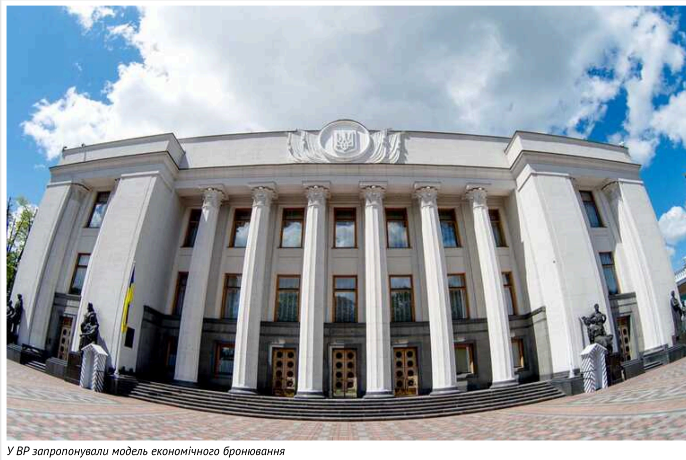
У ВР запропонували модель економічного бронювання

Депутати на протипази ініціативи бронювати від мобілізації тих, хто отримує зарплату більше 35 тисяч гривень, пропонують встановити щомісячний фіксований платіж, який даватиме змогу роботодавцю забронювати працівника незалежно від його посади.