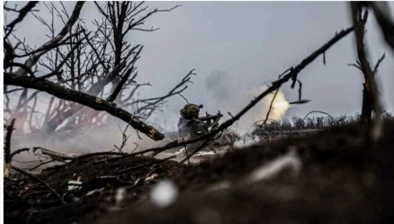
Сили оборони продовжують утримувати та розширювати плацдарми на лівобережжі Дніпра – ОК "Південь"

Воїни Сил оборони України продовжують утримувати зайняті ними позиції на лівому березі Дніпра в Херсонській області, а також розширювати цей плацдарм. Ворог після двох днів тиші відновив штурмові дії та, зібравши сили, здійснив чотири атаки.