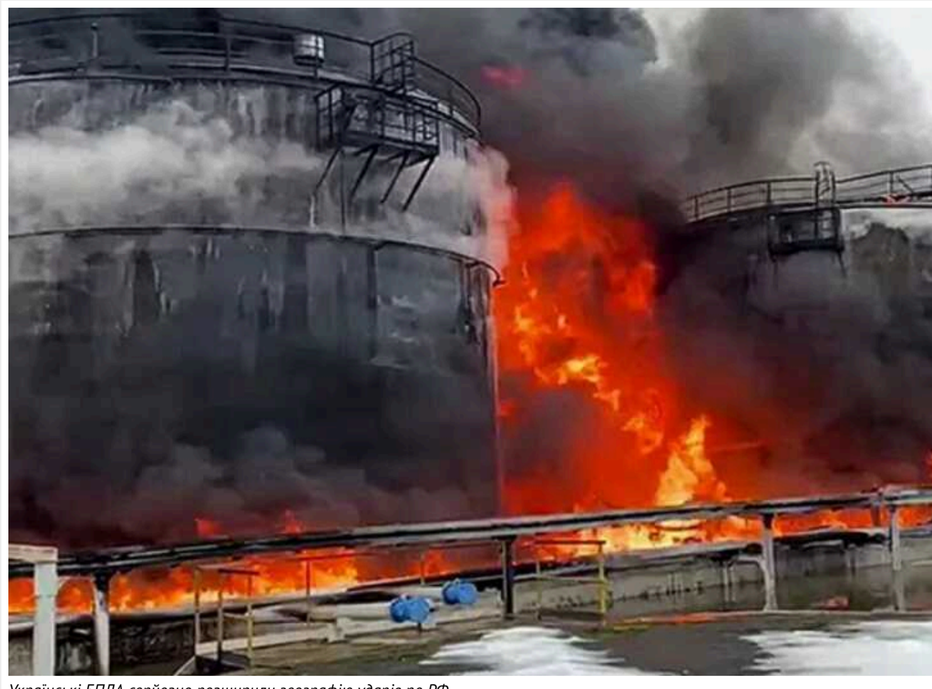
Українські БПЛА серйозно розширили географію ударів по РФ

Країна-агресорка з 2022 року влаштовує нальоти дронів-камікадзе практично по всій території України, але тепер сама зіткнулася з аналогічною ситуацією.