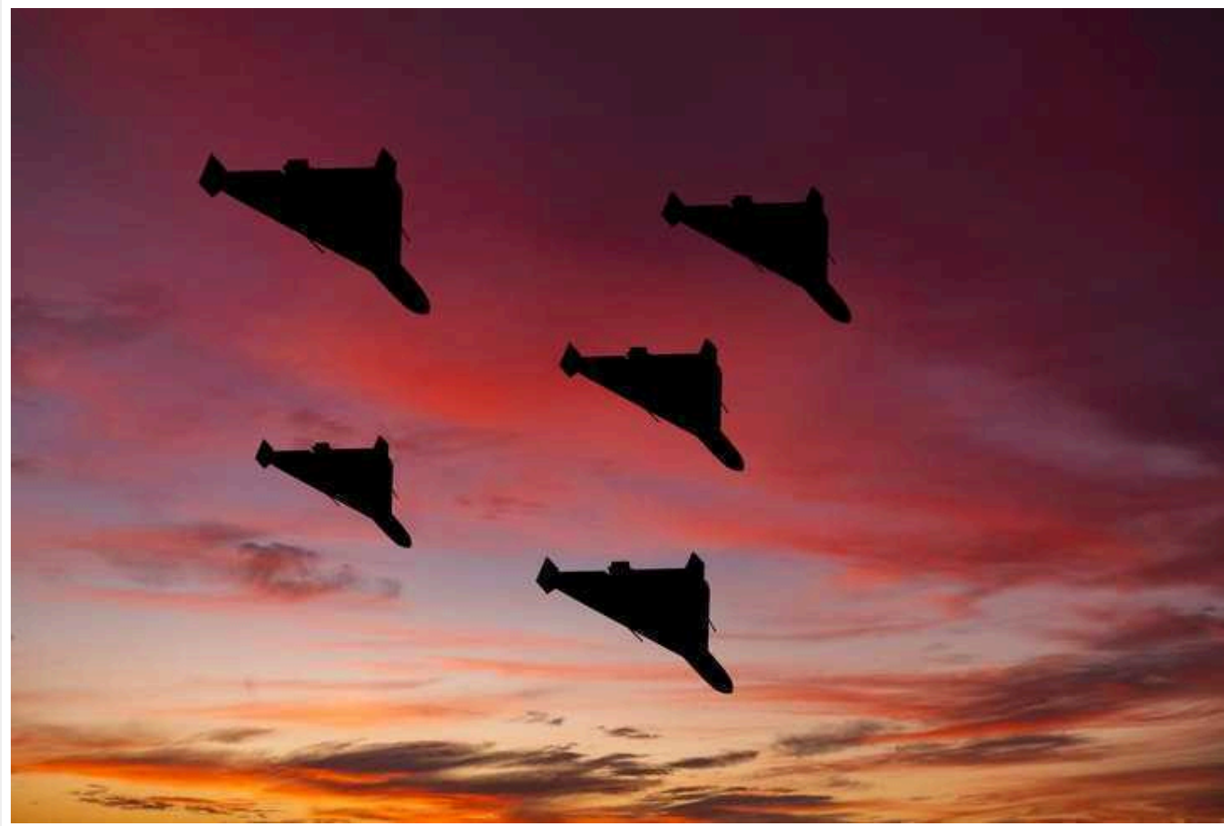
Росіяни атакують Україну "Шахедами"

Російські окупанти сьогодні, 11 березня, увечері запустили дрони-камікадзе "Шахед" по Україні. У низці регіонів оголосили повітряну тривогу.