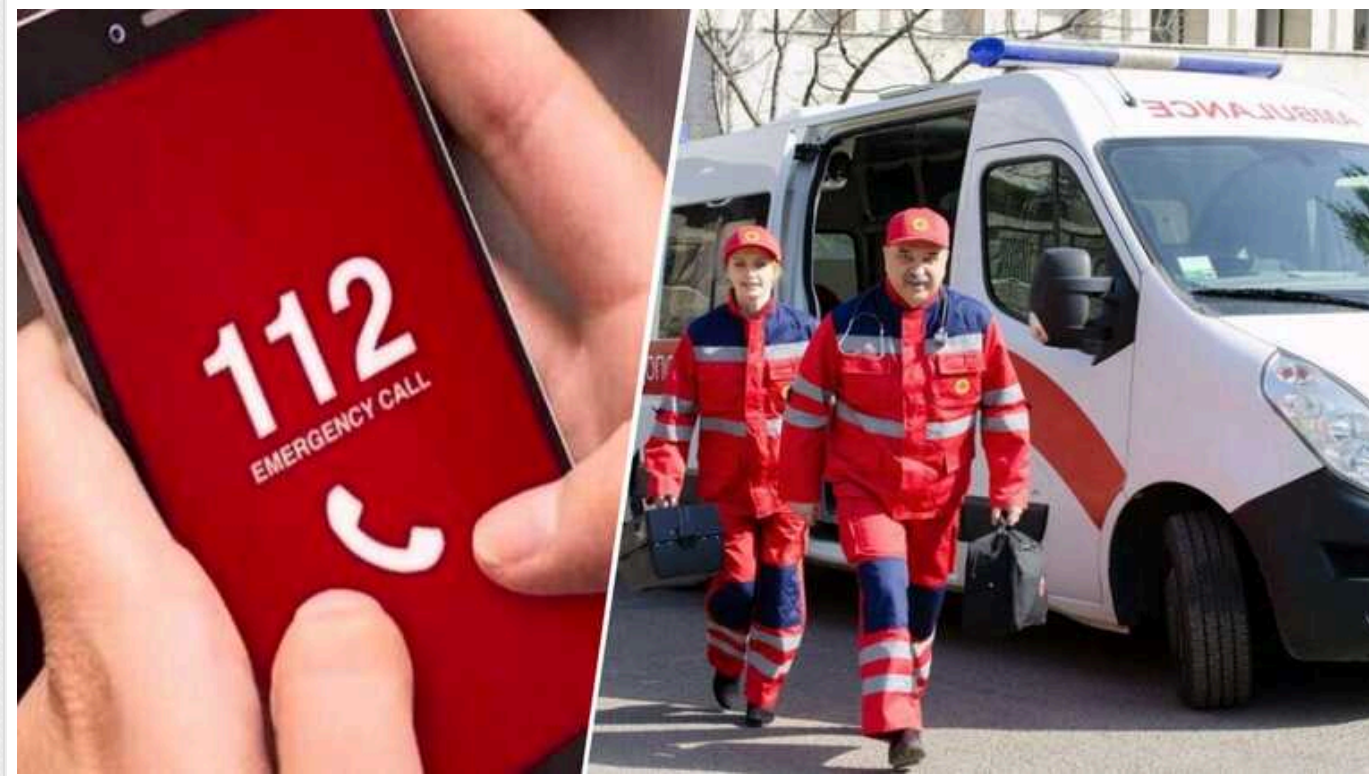
В Україні змінять номер "швидкої допомоги"

Замість номера 103 діятиме номер 112. У майбутньому цей номер буде єдиним для екстрених служб.